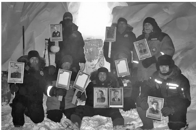
■ | «Бессмертный полк» – традиция российских полярников.

– После школы судьба меня случайно привела в гидрометеорологический техникум в Алексине Тульской области. Я не очень представлял будущую профессию и уже в процессе обучения понял, как это интересно.