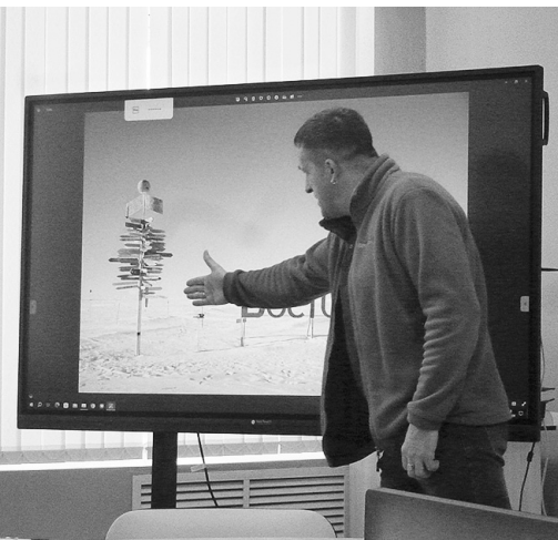
■ На станции «Восток» есть указатель и со словом «Муром».