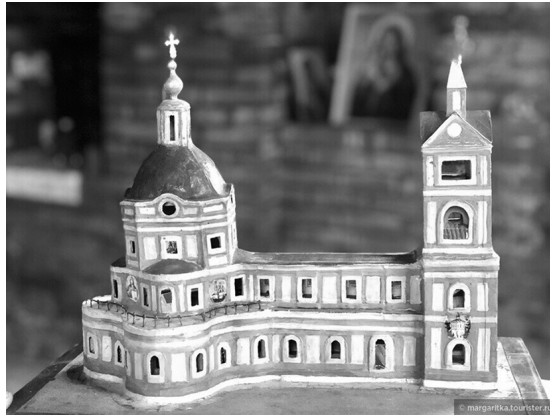
■ Макет храма Вознесения Господня, в котором венчались Екатерина и Дмитрий.

вторых, наука точная у нас. И опытный метеоролог, анализируя твои данные, сразу определит: что-то тут не так! И в-третьих, самому будет неудобно, неловко от этого косяка.