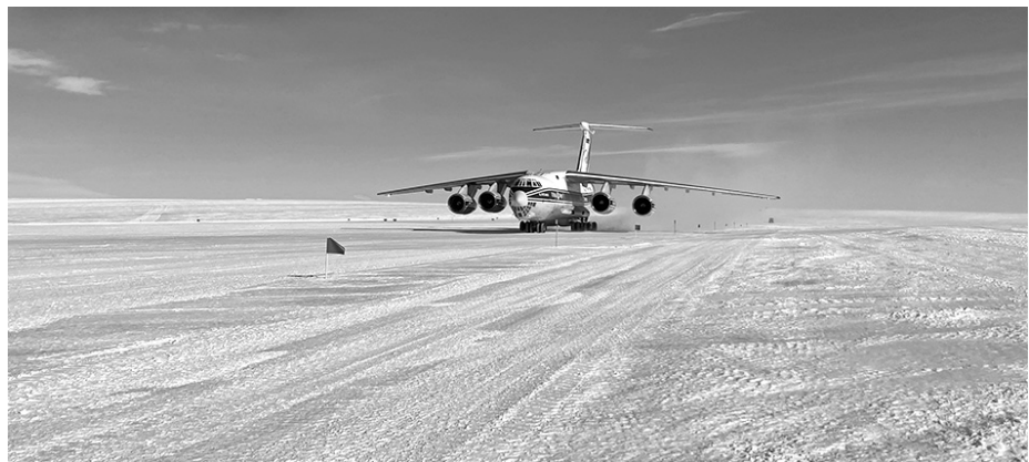
■ | Воздушный «тяжеловоз» на снежной «бетонке» станции «Прогресс».

– Станции выглядят примерно одинаково, – рассказывает Дмитрий Валерьевич. – Это жилые здания, дизель-электростанция, склады. Примерный штат сотрудников – от 12 до 26 человек. Это «наука»: метеоролог, гидролог, геофизик, магнитолог, радиометрист. В штате специалисты дизельной электростанции. Дизели российского производства, они вырабатывают электричество, и станция от него уже отапливается. В штате есть повар, и все работники получают трёхразовое питание. Врач – обязательно. И на каж-