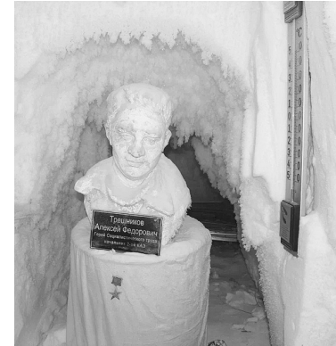
В ледяной нише бюст Героя Социалистического Труда, директора института Арктики и Антарктики (1961-1980) А.Ф. Трешникова.

Ещё в середине 1990-х годов здесь обнаружено подлёдное реликтовое озеро, получившее название Восток. Его вода миллионы лет не соприкасалась с воздушной средой, это своего рода «космический оазис на Земле». Озеро достаточно большое – 250 на 50 км. Буровые работы продолжаются, полученные керны изучаются,