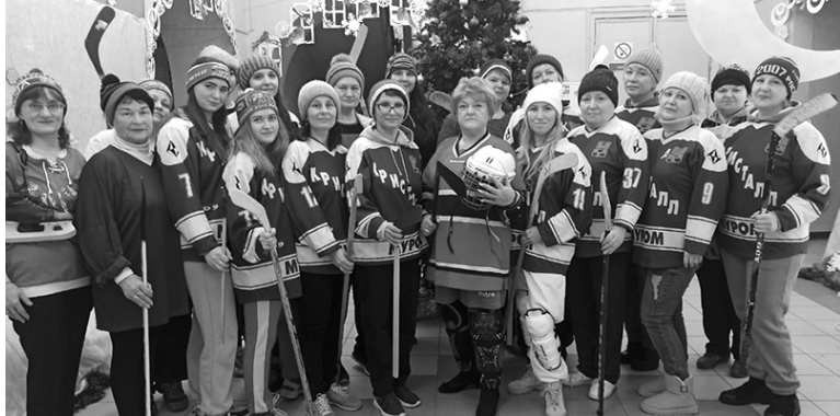
С любимыми учениками.