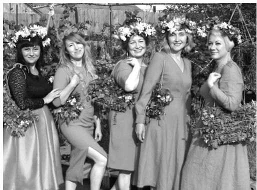
С коллегами из школы № 12.